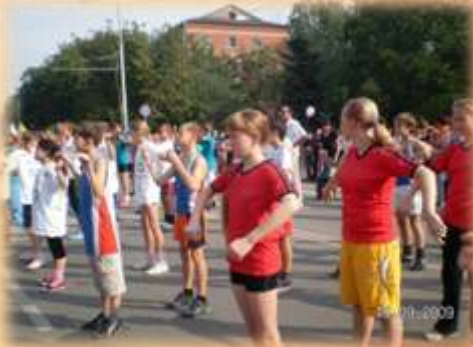
Зарядка с чемпионами

Члены спортивного клуба, активные помощники в проведении акций и участники творческих проектов