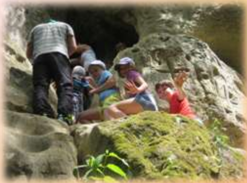
Походы выходного дня