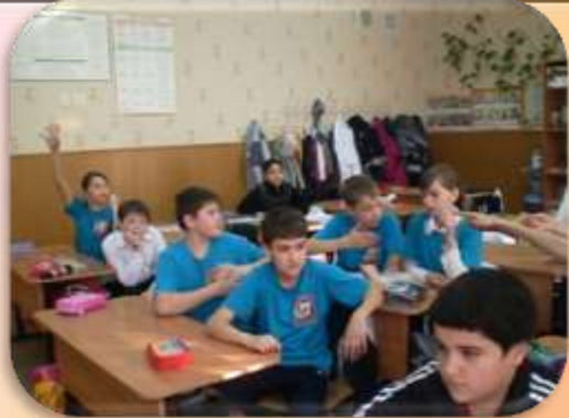
Игра по станциям «Здоровье нации»