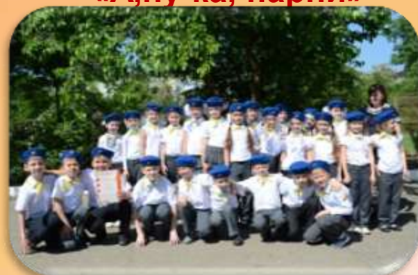
Смотр строя и песни