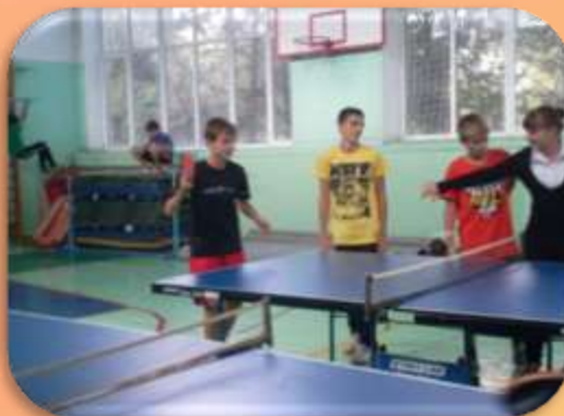
Соревнования по настольному теннису