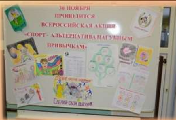
Акция «Спорт –альтернатива пагубным привычкам