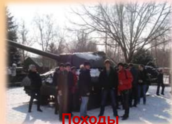
Походы выходного дня