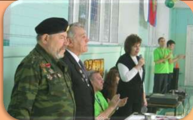
Спортивный праздник «А, ну-ка, парни»