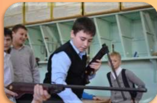
Соревнования по стрельбе